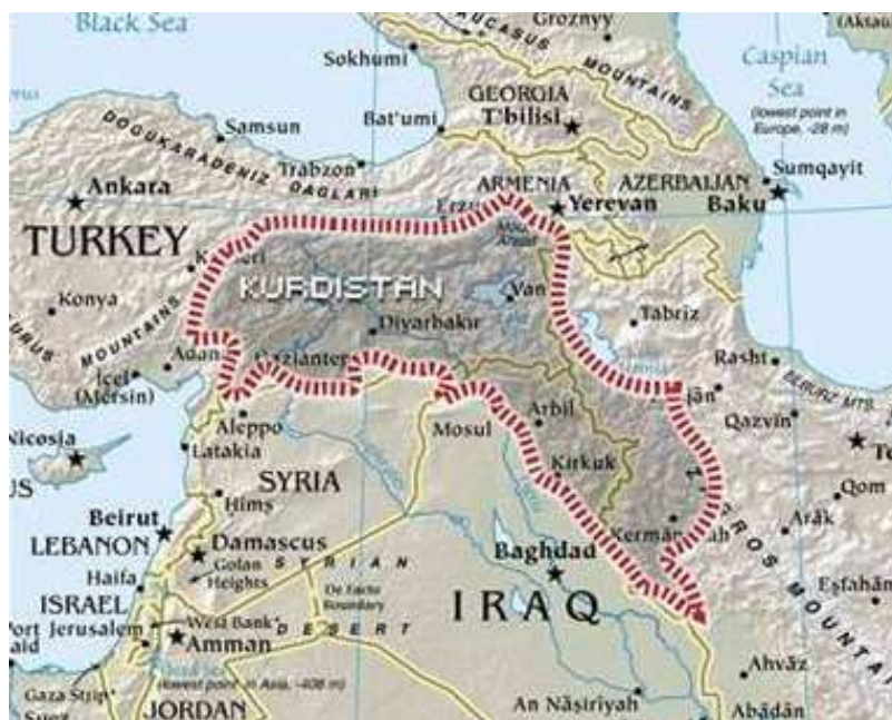
1. ábra: Kurdisztán

A mai Kurdisztánnak nevezett terület legalább négy ország területére – Törökország, Irán, Irak és Szíria – terjed ki, és több mint 400 ezer km 2 -en terül el. Legnagyobb egysége Törökország keleti tartományait képezi az Anatóliai-magasföld keleti részén, nagyjából a Tahtalı-hegységtől keletre és az Araszi-hegységtől délre fekvő területen, egészen az iráni és szír határig. Iránban a kurdok az ország nyugati határai mentén, körülbelül 100-200 km széles sávban, a Zagrosz-hegyvidéktől északnyugat felé élnek. Irakban a Kirkuktól és Moszultól északra fekvő hegyvidék a kurdok lakta térség, ahogyan Szíria kb. 50 km széles északi határsávja is. Kurd nacionalisták szerint Kurdisztán szerves része a mai Örményország kurdok által lakott része is.