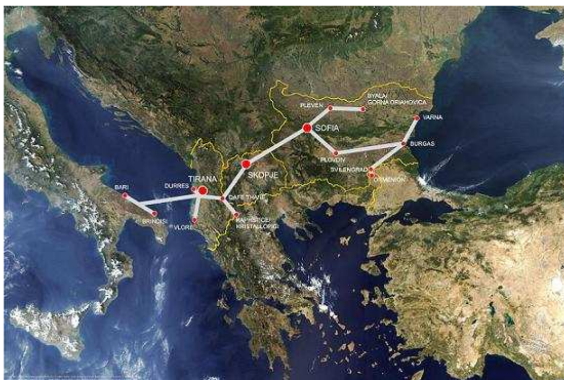
2. ábra: A VIII. számú Páneurópai Korridor terve

Az elmúlt években az olasz politika „elhanyagolta” a VIII. Korridor tervét, és egyéb „nagy” infrastrukturális beruházásokra koncentrált. Eközben a többi korridor kiépülése terén komoly eredmények születtek, köszönhetően az azokban érintett országok hatékony politizálásának.